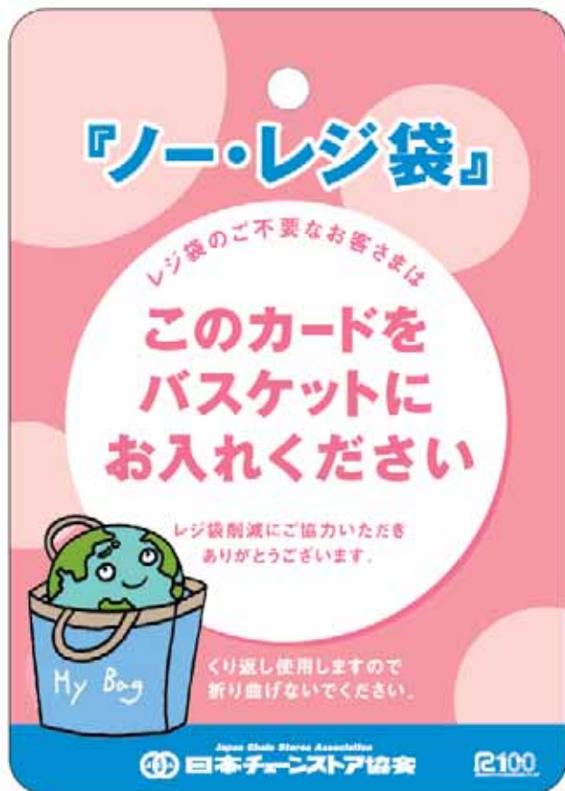
「レジ袋ご不要カード」