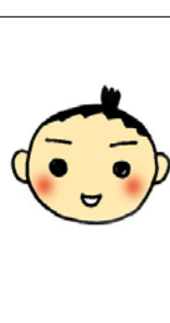
上大岡トメ （イラストレーター）

文化庁文化審議会国語分科会委員も務める。恋愛をテーマとした川柳作品を多数発表。川柳のすその尾を広げる。